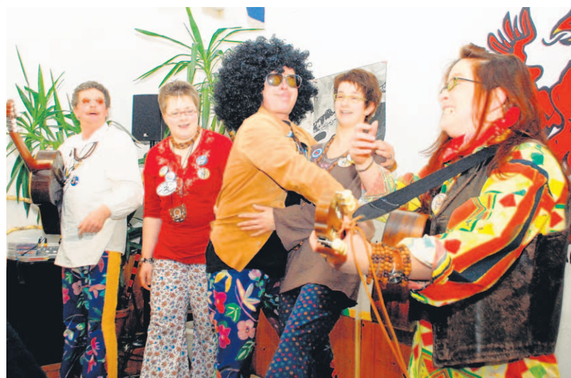
Auch die Gruppe Flower-Klauer will dabei sein, wenn am Samstag, 19. Mai, das große „Sommer-Fasnet-Festival“ bei der Weinhandlung Riegger im Gewerbegebiet Vockenhausen in Villingen über die Bühne geht.

Villingen-Schwenningen – Mit dabei sind die vortrefflichsten Gruppen und Publikumsliebhaber, die an der Fasnacht mit ihren Liedern und kabarettreife Auftritten durch Kneipen und Stühle tingeln: die Biergit-Sisters, die Flower Klauer, die Sockemolli und Hills Angels, Gunther & Henry, Vogel-frei, die Rentnerbänd, Total Verkehrt und das Männerballett der Katzenmusik. Möglicherweise stoßen noch weitere dazu. Beginn ist am Samstag, 19. Mai, um 14 Uhr im Innenhof der Firma Wein-Riegger im Industriegebiet Vockenhausen (Werner-von-Siemens-Straße 8). Das Beste daran: Die Veran-