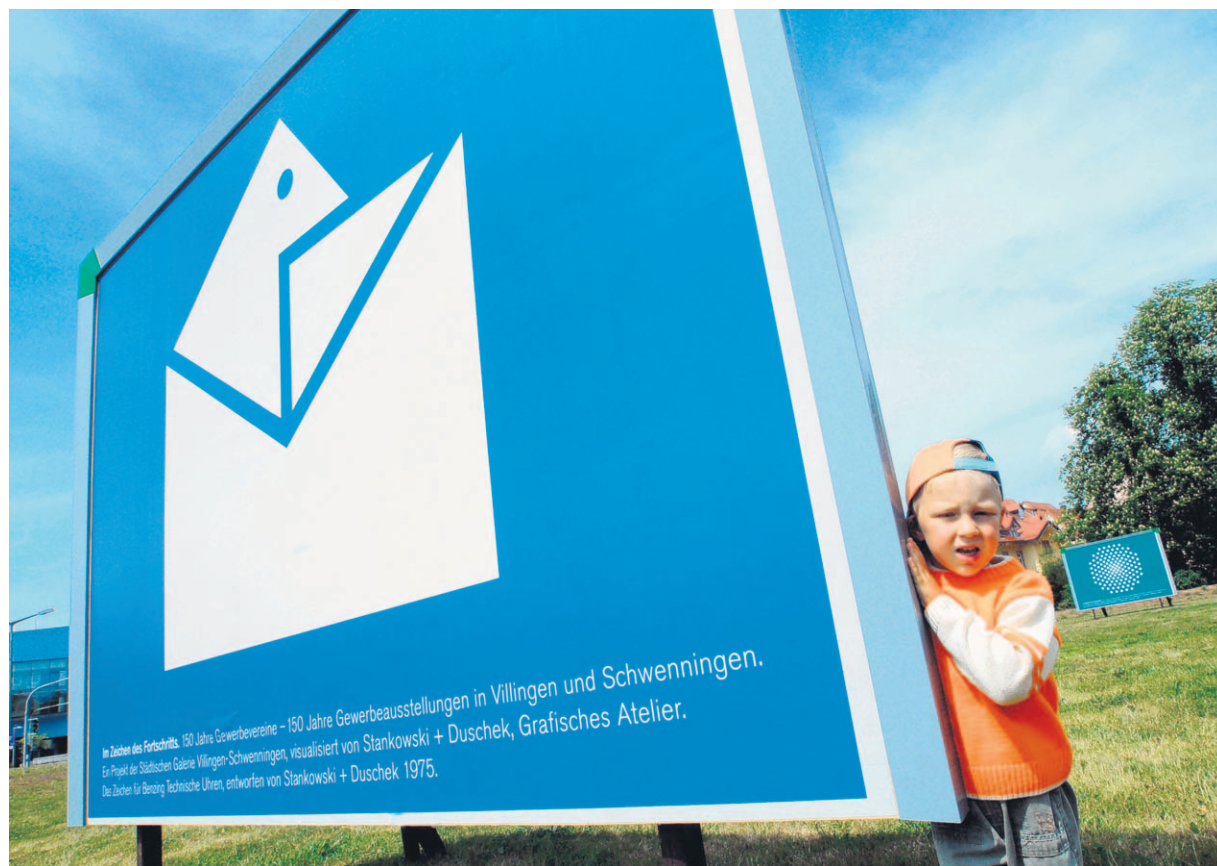
Die Plakatgalerie mit den insgesamt 21 Werken des Designers Stankowski begleitet die Ausstellung „Im Zeichen des Fortschritts“ zum 150-jährigen Bestehen der Gewerbevereine in Schwenningen und Villingen.